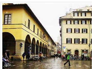
L'Accademia delle Belle Arti di Firenze